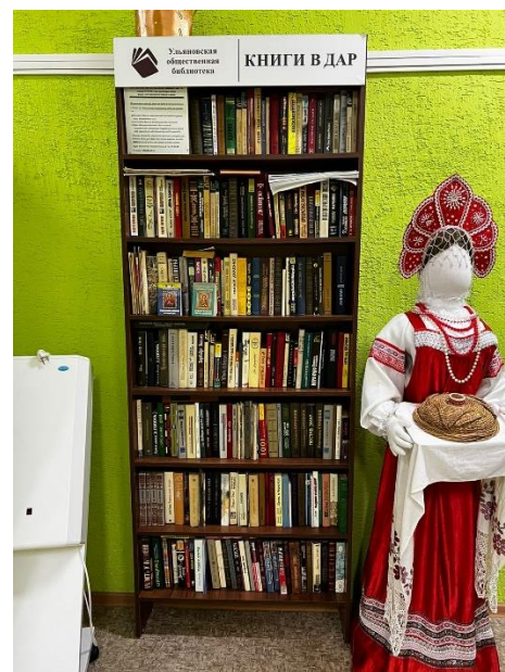
Стеллажи книги в дар в общественных местах города Ульяновска

Список партнеров Общественной исторической библиотеки за 2022 г.