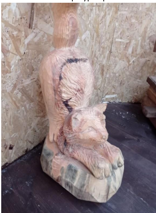
Резная фигура –кошка