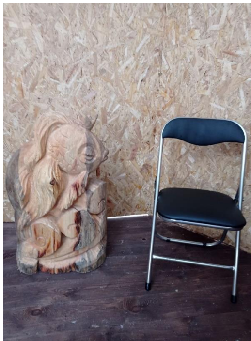
Резная фигура –рыбка