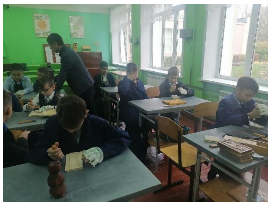
Средняя школа №31