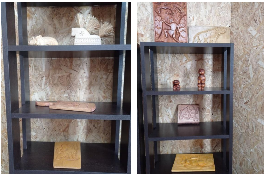
Резные картины и миниатюры из дерева