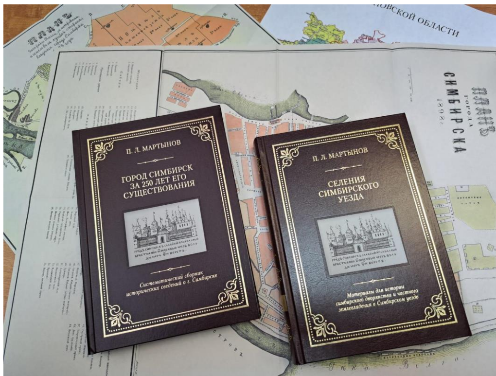
Двухтомное издание сочинений П.Л.Мартынова

Данное издание не будет доступно в свободной продаже. Часть тиража изданных книг поступит в 50 публичных библиотек Ульяновска. Для того чтобы получить бесплатно уникальное историко-краеведческое издание, нужно принести в пункт приема Общественной исторической библиотеки в обмен 20 книг хорошего качества и содержания. Наш сотрудник на месте проверит состояние принесенных книг и, в случае соответствия правилам, предоставит в обмен на выбор издания «Собрание сочинений П.Л. Мартынова», состоящее из двух томов, и книгу-альбом «Старый Симбирск».