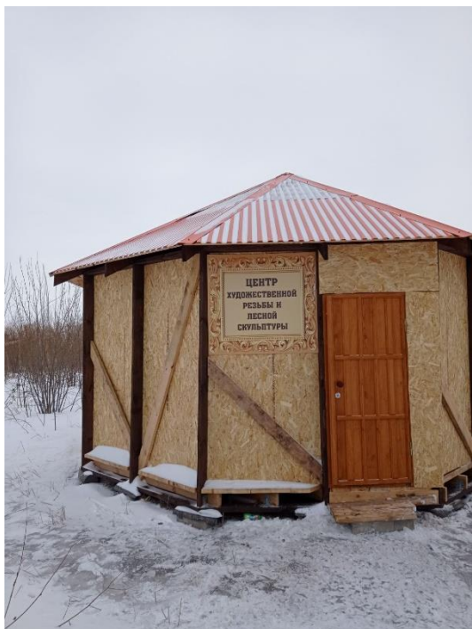
Павильон центра резьбы по дереву

Проект позволил создать в Ульяновске Цент резьбы по дереву, в котором все желающие смогут опробовать свои силы в искусстве резьбы по дереву, ознакомиться с работами мастеров как в виде не больших резных миниатюр и картин, так и больших деревянных скульптур, которые можно увидеть в центре.