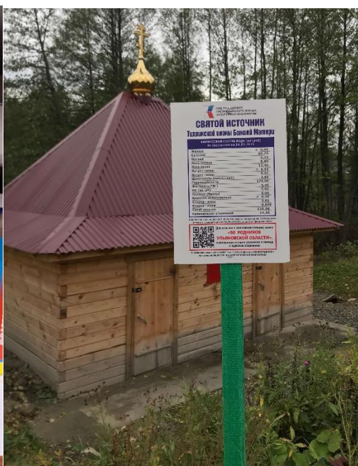
Справочник «50 родников Ульяновской области»