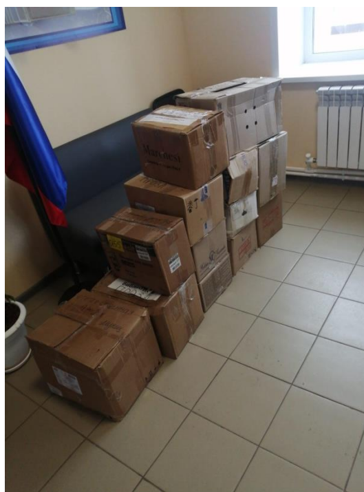
Книги, доставленные в сельские библиотеки Ульяновской области.

Новые адреса установки книжных боксов в г.Ульяновске: