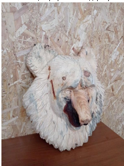
Резная фигура –медвежья морда